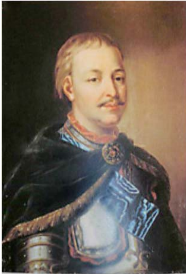
Гетьман Іван Мазепа