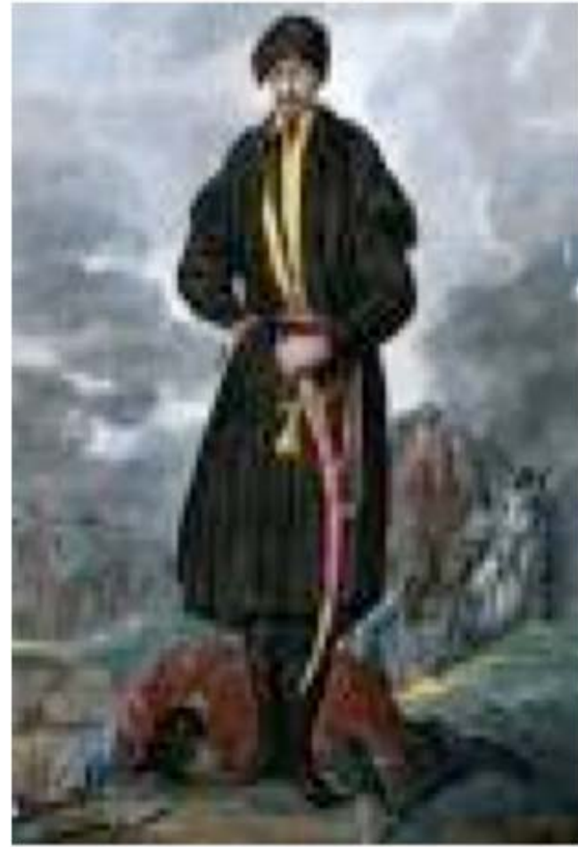
Запорозький кошовий Кость Гордієнко