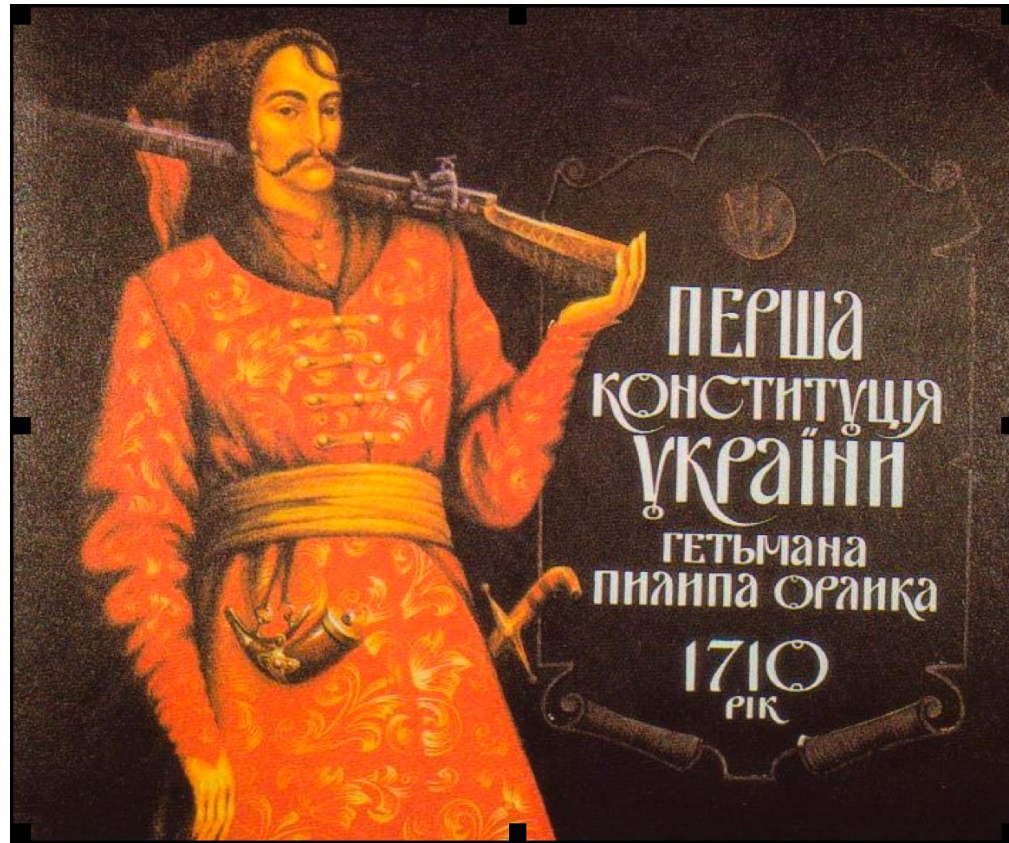
Бендерська конституція Пилипа Орлика 1710 року