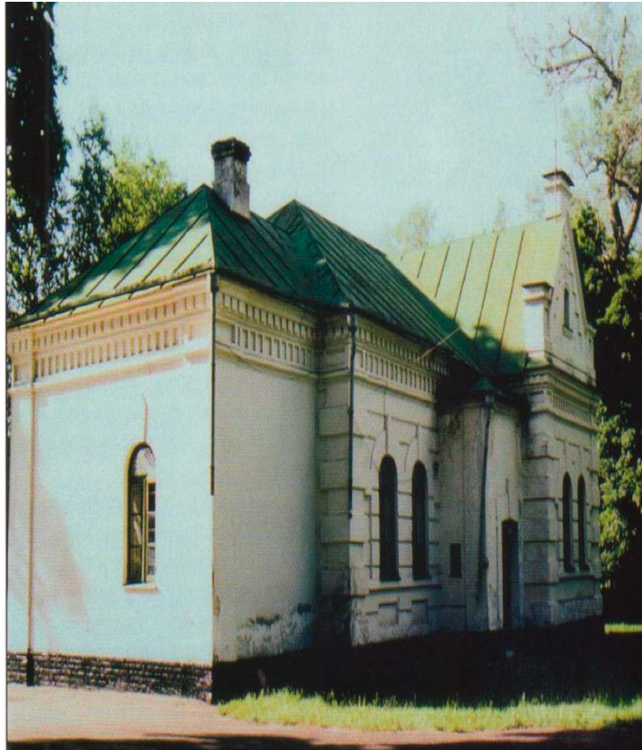
Будинок Генерального суду в Батурині