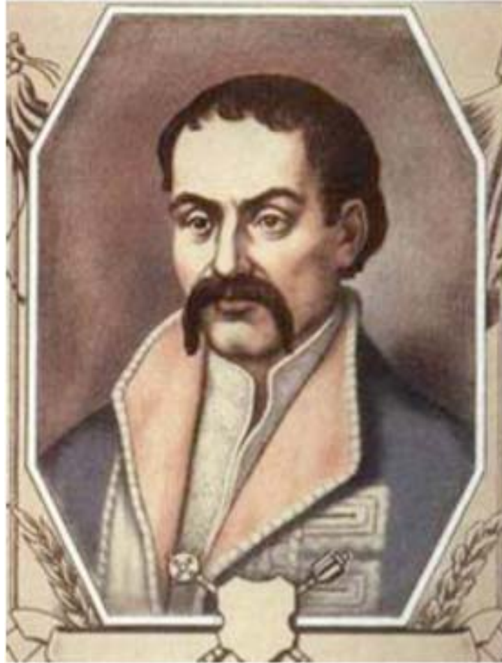
Гетьман Пилип Орлик