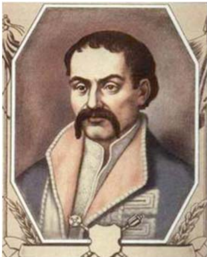
Гетьман Пилип Орлик