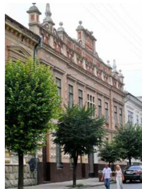
Польський Народний Дім