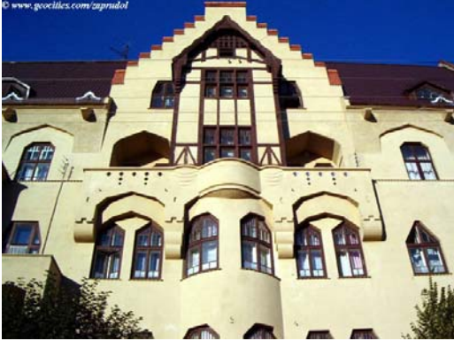
Німецький Народний Дім

3. Назвати провідні галузі народного господарства сучасного міста Чернівців .