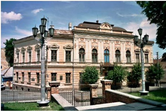
Український Народний Дім

За австрійського часу був такий розподіл національних груп у Чернівцях: українців — 19 %, румунів — 15 %, німців — 17 %, євреїв — 33 %, поляків — 15 %. Кожна з національностей мала свій Народний Дім, який був осередком національно-культурного життя.