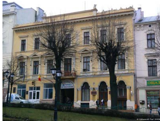
Румунський Національний Дім