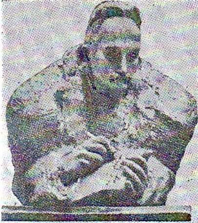
Іван Франко Різьба О. Архипенка