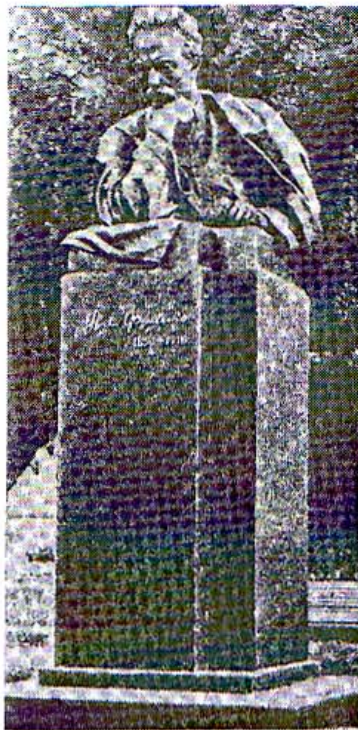
Пам'ятник І. Франкові у Києві

Тут я сидів цілими годинами, дивився, слухав і дивився. Все мене цікавило. Мені зовсім не нудилося дивитись хоч і як довго на вогонь, на ту невеличку, синяву полумінь, що мов впливала лагідно з розжареного, червоного вугілля при рівнім, однастайнім подуві міха. Я слідив за кожним куснем вугілля, як він зразу чорний, облитий тим синявим вогником, поволі червонів, а далі білів, розпадався на кусники, меншав і танув, мов потовчений срібlistий лід. Так само й залізо, розпалюване в огні, цікавило мене. Я лякався за нього, скільки разів батько в кліщах всував який кусень до грані. Мені здавалося, що й воно