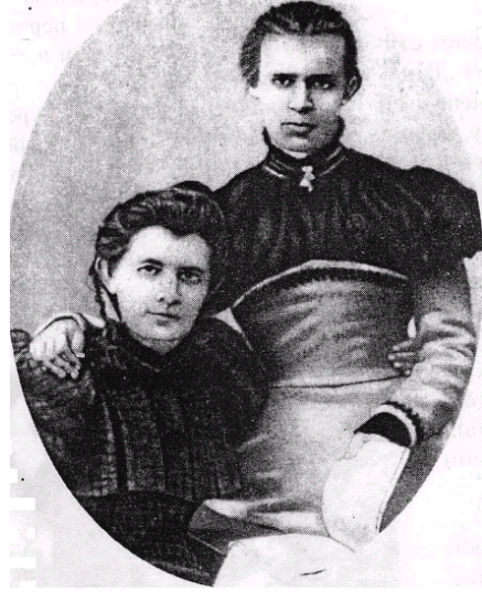
Леся Українка з мамою, Оленою Пчілкою