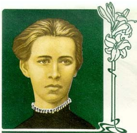
Леся Українка 1871—1913