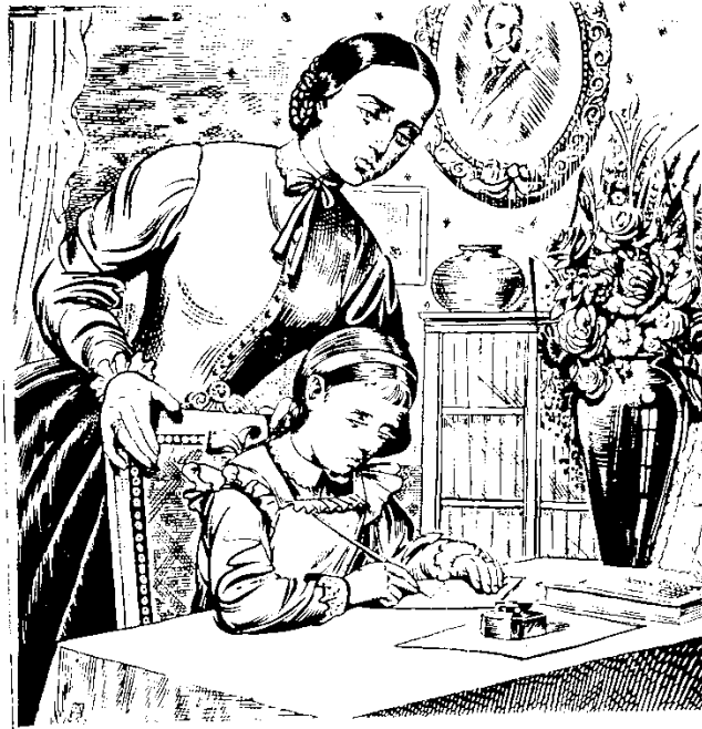
„НАДІЯ” — ПЕРШИЙ ВІРШ ЛЕСІ УКРАЇНКИ