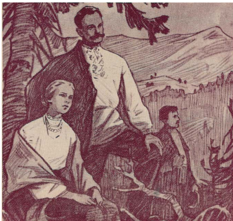
Леся Українка з своїм другом Іваном Франком у Карпатах