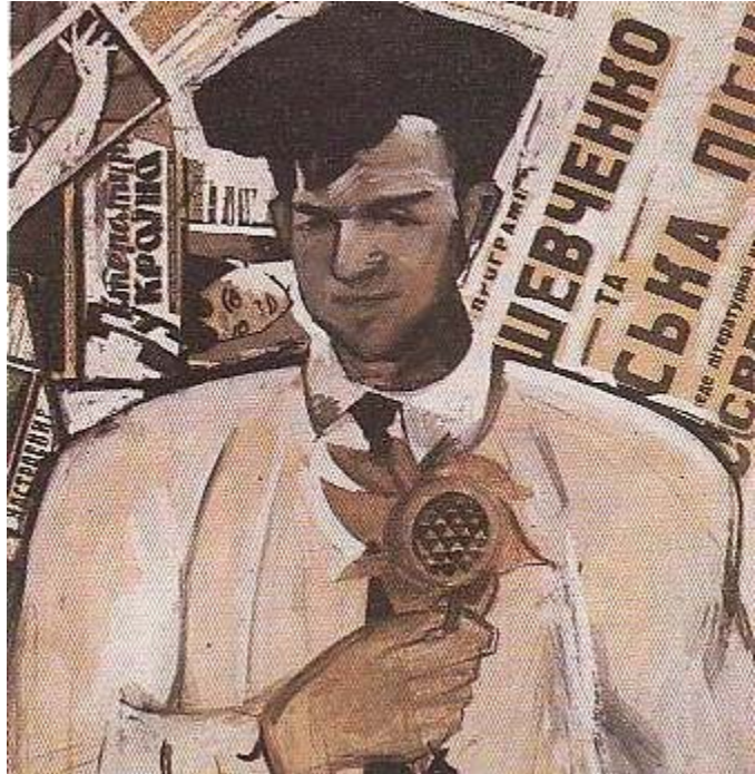
„Соняшник” Портрет Сверстюка (письменник)