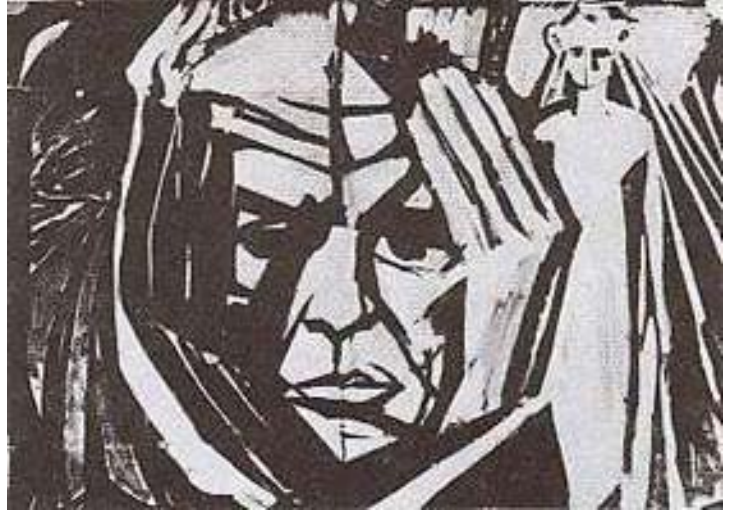
О. Довженко, портрет намальований 60-их роках (Довженко працював у кіно)