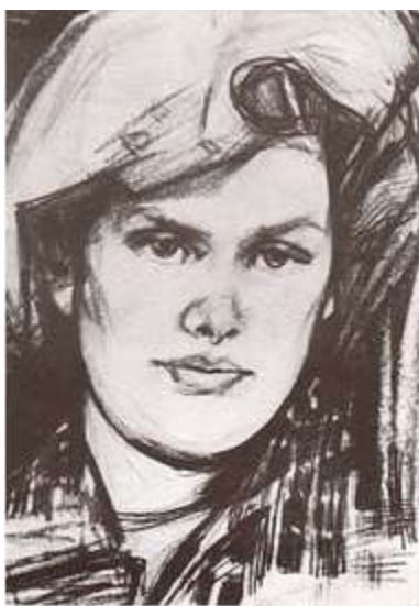
автопортрет Алли Горської 1960

Квіти та Фотографії Алли Горської на Похороні у Києві, 7 грудня, 1970