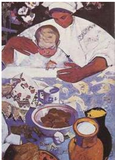
Абетка" Картина, 1962