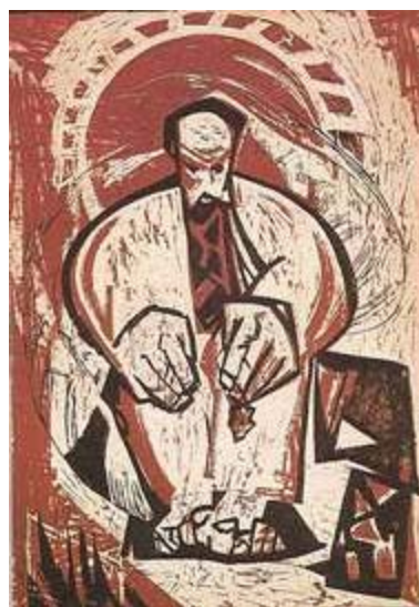
Дума (Т. Шевченко) 1963