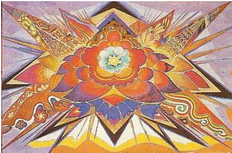
„Вугілля Квітка”, Велика Мозаїка, в адміністративному будинку Краснодон корпорації, в Україні, намальовала 1968