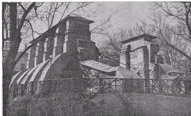
Золоті Ворота, символ Української Державности після відновлення

Під Золотими Воротами не раз відбувались криваві битви. Це спричинило часткове ушкодження брами, хоч її будова була міцна. У 1320 році її перебудовано і звужено до 5 метрів.