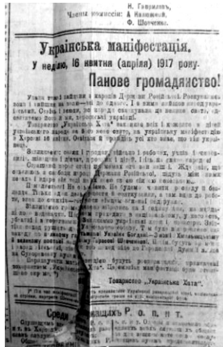
Газета "Родной Край" № 1452, 15 квітня 1917 року

Чи замислювались ви над тим, що переживав Херсон у бурхливі та переломні моменти світової історії? Як виглядав будинок Миської Думи у буремній березень 1917? Солдати якої армії крокували по вашій вулиці якихось 90 років тому? Як населення нашого міста сприйняло ІV Універсал Центральної Ради?