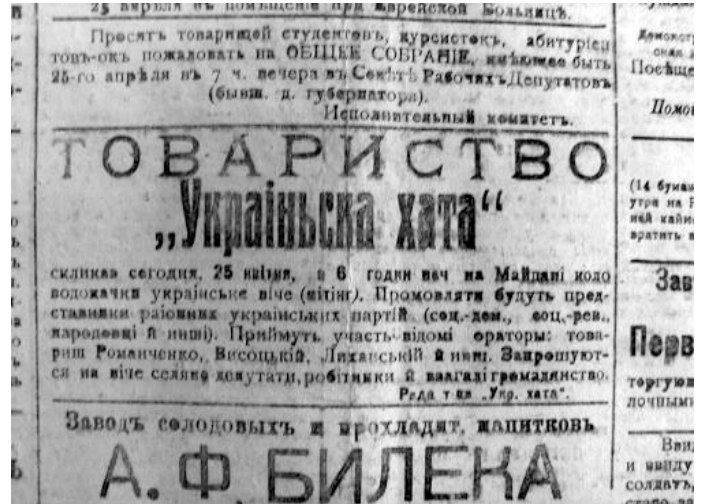
Газета "Родной Край" № 1459, 25 квітня 1917 року

В колоні маніфестантів військові команди чергувалися з мирними обивателями, оркестри і хори (оркестри: учнів, 44 піхотного запасного полку, Таврійської дружини, хори: учнів, аматорської трупи, військовий) розташувалися в усіх частинах колони. Лунали "Україна", "Марсельєза", "Ще не вмерла Україна" й "Заповіт". Музика і пісні були чути усім, солдати додали блиску, домашні "корогви", національні й революційні прапори створили урочисту й святкову атмосферу. До речі, репортери нарахували більше 30 українських прапорів. Серед найголовніших закликів маніфестанти несли наступні: