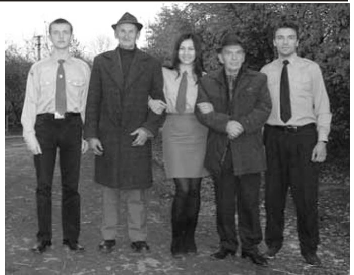
Сумівці з Кошляків та сучасні сумівці (під час відзначення 60-річчя діяльності СУМ в селі Кошляки)

Створена в 1948 році за сприяння ОУН організація молоді в селі Кошляки під назвою СУМ мала на меті вести підривну діяльність