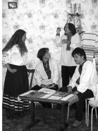
Вистава до Дня Святого Миколая, 2006 рік

У такому форматі ми вже неодноразово проводили дні українського кіно, показува-