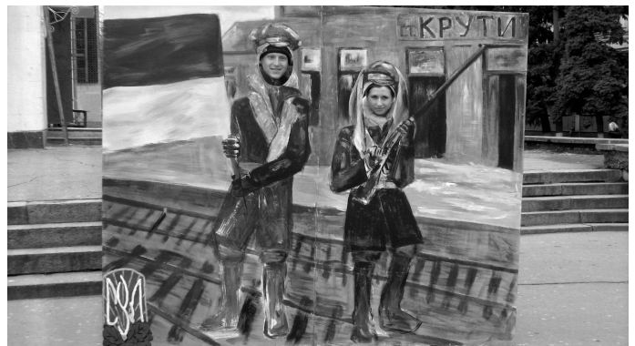
Учасники акції - пересічні херсонці біля стенду, присвяченому подіям січня 1918 року

Лише згодом, у 2006 році на місці бою встановлено пам'ятник і у 80-ті роковини бою монетним двором випущено в обіг пам'ятну гривню.