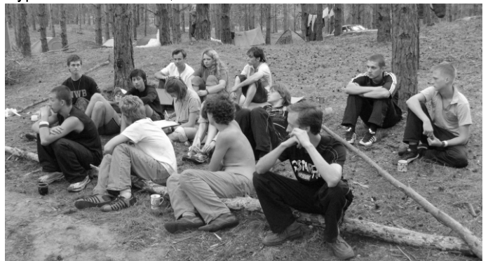
Літо 2007 року. Вишкільний табір ім. Тараса Чупринки

А.Ш. - Близько 15 чоловік, переважно студенти херсонських вишів. Хоча у спілці є і викладачі, лікарі, банкіри та журналісти. Загалом, за час