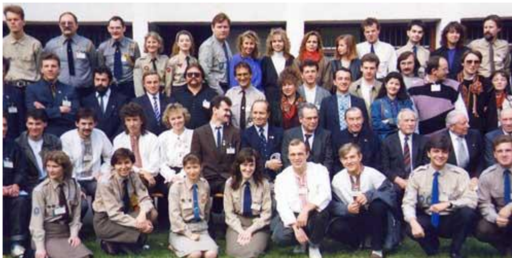
Зустріч дружинників з молодими активістами з України, Мюнхен '90

1970-х років. На жаль, українська держава не дуже переймається своїми громадянами, а тим паче українцями в діаспорі.