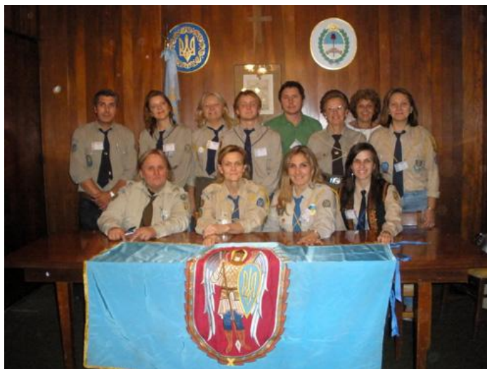
Крайові Органи СУМ в Аргентині (2009-2011рр.), обрані XXIIм Крайовим З'їздом 9-го травня 2009р.

В суботу 9-го травня 2009 року відбувся XXII Крайовий З'їзд Спілки Української Молоді в Аргентині. З'їзд відбувся в домі Централі Українського Культурного Товариства "Просвіта". Після уділення абсолюторії відступаючій Управі, Номінаційна Комісія прочитала листу Новообраної Управи.