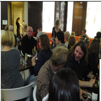
Разом в ресторані на вечері в Канберрі...

Інший учасник сказав таке – “Багато цікавих інновацій і інформації – почуваюся мотивованим до подальшої праці в рядах СУМу...”