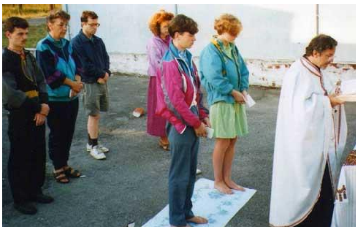
Хрестини на таборі, Шестовиця '93

Я відповіла на це вже у другому питанні. Додам тільки одну інформацію: дуже важливим принципом у нашій співпраці було, є і, маю надію, залишиться те, що члени Світової Управи СУМ діяли тільки тоді, коли зацікавлення до них виявляла Україна і конкретно запрошувала представників Світової Управи СУМ в Україну. Ми дуже звертаємо увагу на „голос – бажання” з України.