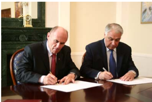
Стефан Романів Ген Секретар СКУ , Юрій Костенко во Міністра Закордонних Справ України

Документ передбачає поглиблення співробітництва із забезпечення захисту інтересів закордонних українців у державах світу, підвищення позитивного міжнародного іміджу України, збереження та популяризації української мови в діаспорі та в Україні, визнання Голодомору 1932-1933 рр. в Україні геноцидом українського народу, сприяння в реалізації європейських та євроатлантичних прагнень України