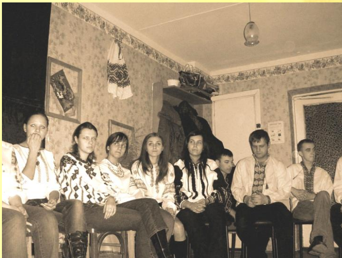
Андріївські вечорниці у Тернопільському осередку. 2006 рік

Отож не прогавайте нагоду цього річ відвідати таке свято чи зорганізуйте його самі – на щастя, інформації у книжках, довідниках та Всесвітній мережі є вдосталь. Море вражень та привід для приємних спогадів – гарантовано