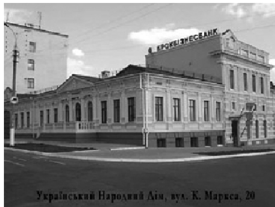
Український Народний Дім, вул. К. Маркса, 20

Так завершився перший рік історії масового українського національного руху на Херсонщині. Його документальними пам'ятками стали статутні