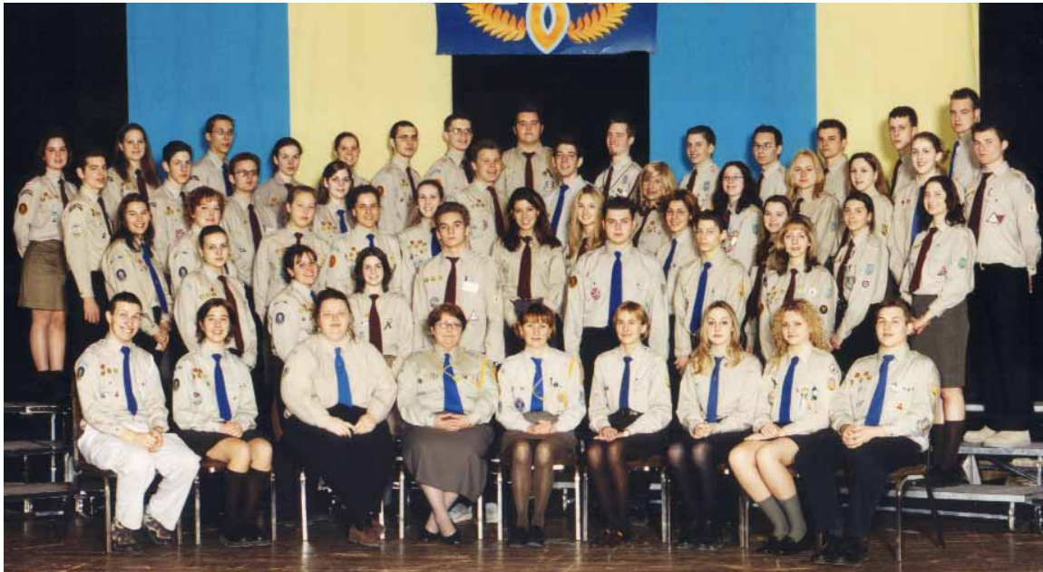
- учасники Провідницького Семінару в Торонті -

В додатку учасники семінару брали участь не лише в першій Пленарній Сесії XXVI Крайового З'їзду, щоби обзаяомитись з ширшою діяльністю Спілки в Канаді але і в першій спільній сесії організаційного характеру на тему „Можливості і перепони до включення молодічленства в діяльність СУМ“. В неділю відвідали виставку „Скитське Золото“ і мали можливість коротко оглянути місто Торонто туруо автобусом..