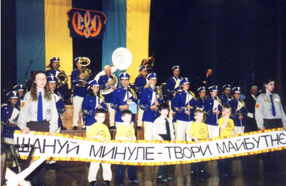
- оркестра „Батурин“ і суменята О СУМ Етобіко тримають гасло -

присутніх, хлібом і сіллю, юнацтво відспівали кілька пісень і декламували вірші. Мистецьку частину вечора, доповнювали духови оркестра „Батурин“ і недавно створений ансамбль бандуристів „Дніпрові Хвилі“ осередку СУМ Етобіко. Всі виконавці були нагороджені рясними оплесками.