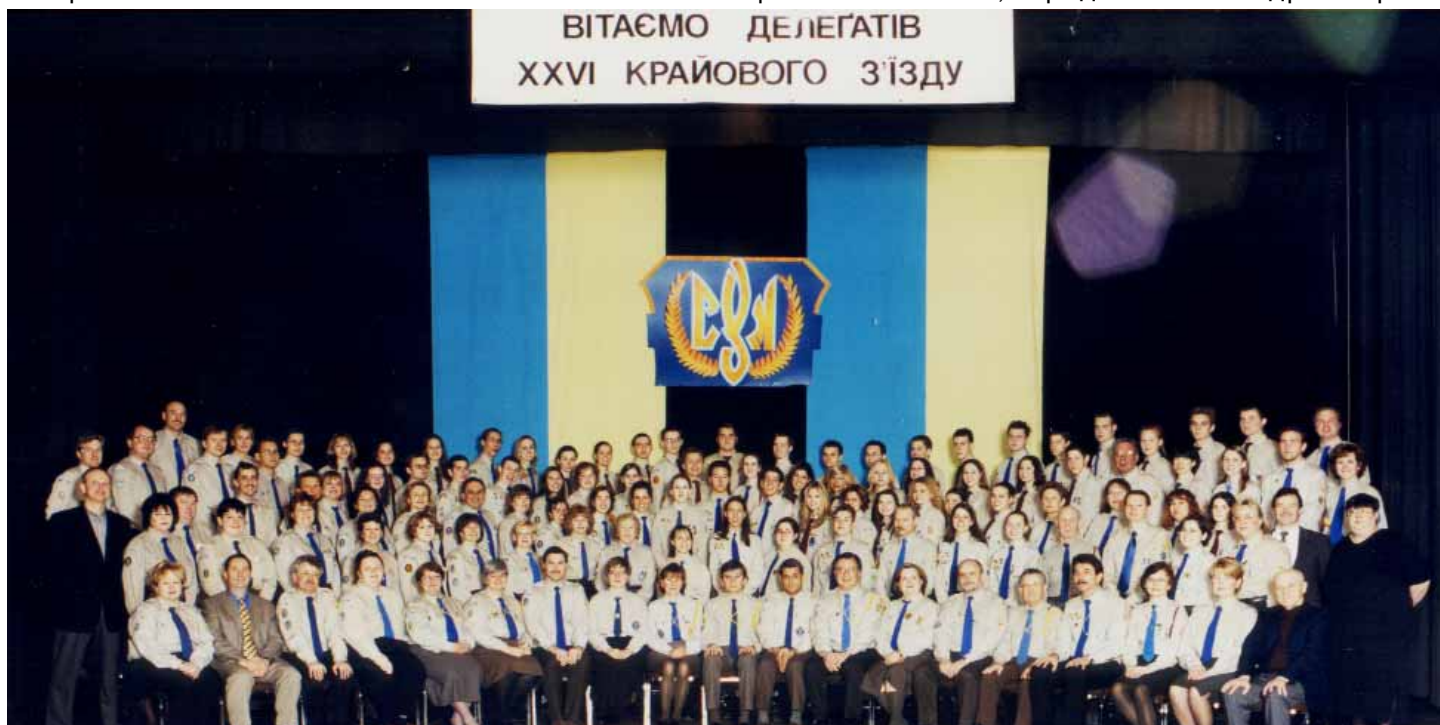
- делегати, старше юнацтво і молоді дружинники XXVI Крайового З'їзду СУМ в Канаді -