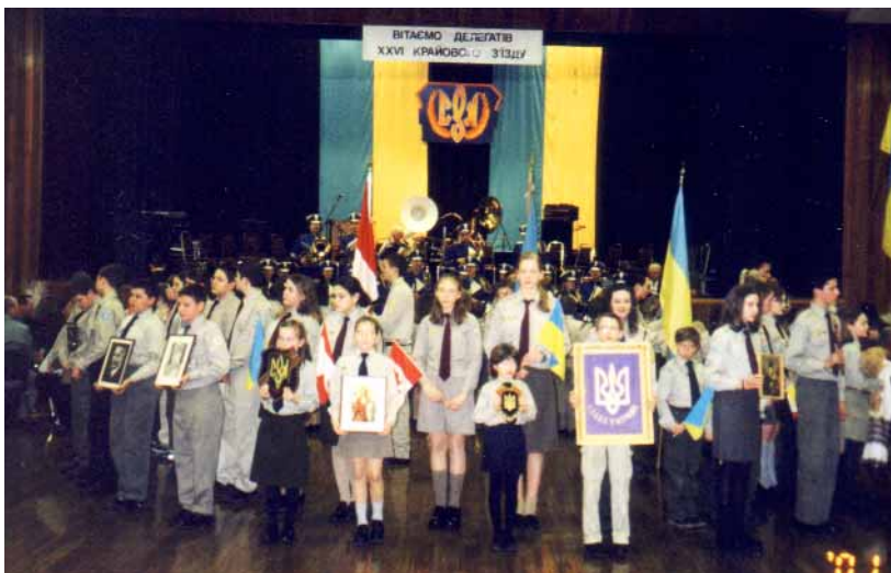
- юнацтво Осередку СУМ ім. Симона Петлюри в Етобіко -

закликав всі установи та цілу громаду допомогти їм в сповненні їхнього важкого обов'язку на користь цілої нашої громади в Канаді, провідниками якої буде нинішня молодь.