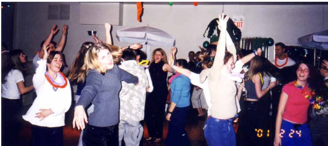
- Учасники Провідницького Семінару забавляються під час Товариської Зустрічі -