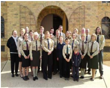
Учасники конференції перед УКЦ -парафії Св. Володимира – після Св. Літургії...