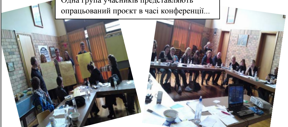
Одна група учасників представляють опрацьований проєкт в часі конференції...